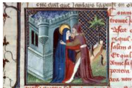
Besançon, B.m., ms 550, fol. 54 Première moitié du XV e siècle

Toutefois, ce thème iconographique n'est pas sans ambiguïté. Jean Molan, théologien de la contre-Réforme 3 pense que la Rencontre à la Porte Dorée est abusivement considérée comme le moment et le Baiser le moyen, de la conception de la Vierge : « sa conception par un baiser est une fable et l'obscur fiction de certains ». En effet, cette image ne doit pas être systématiquement interprétée comme immaculiste. La connaissance du contexte est nécessaire pour en préciser la nature et l'interprétation théologique