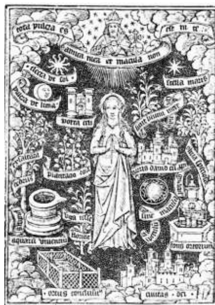
Livre d'Heures imprimée, édition parisienne, Thielman Kerver Début XVI e siècle

Les livres d'Heures imprimés ont grandement contribué à répandre cette iconographie en France et à Paris à partir de 1500. On trouve nombre d'exemple chez Anthoine Vérard ou Thielman Kerver. Ce thème connaît par la suite une très grande popularité, dans tous les supports, jusqu'à la fin du XVI e siècle.