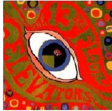
13 th Floor Elevators « The psychedelic sounds of the 13 th Floor Elevators »