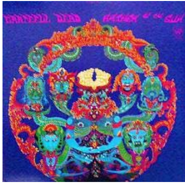
The Grateful Dead « Anthem to the sun »